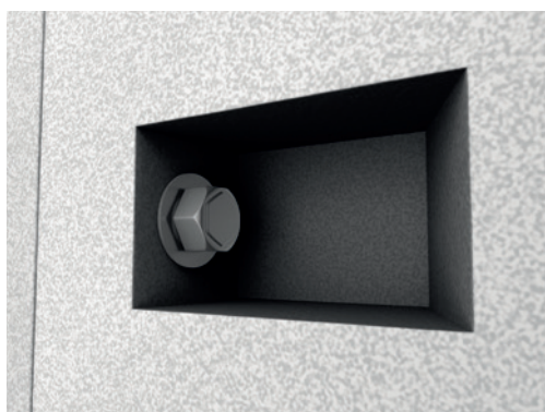
Logement pour boulonnage des plaques et des angles